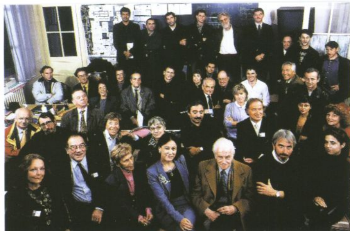
Photo de classe d'écrivains réalisée lors du lancement de Lire et faire lire.