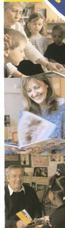
Édition septembre 2007 • Création, légètype, typographies et dépliant : Ediliana Bonté divine / • Photos : Aude Laporte • Photo de classe des écrivains : Pascal Rostain.

Lire et faire lire, un appel aux bénévoles pour transmettre aux enfants le plaisir de la lecture